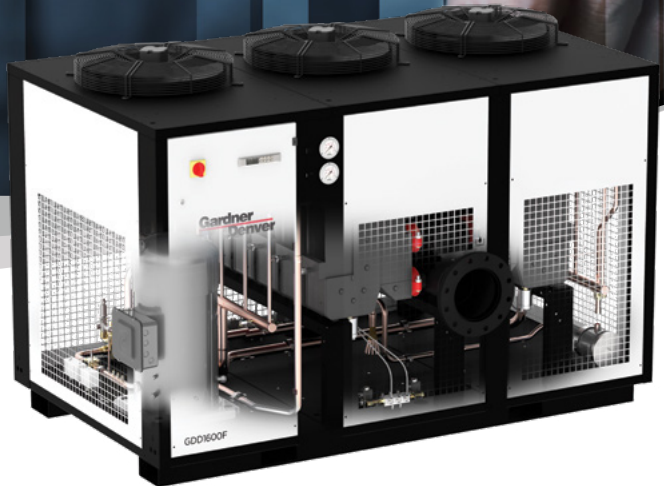
Modèles présentés : GDD1460F