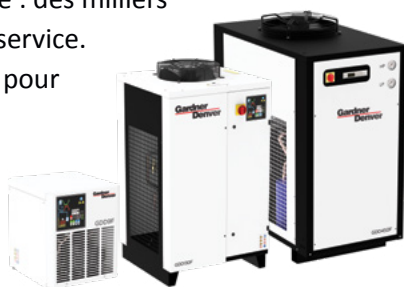
Modèles présentés : GDD9F, GDD130F, GDD450F