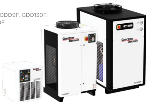
Modelo GDD9F, GDD130F, GDD450F