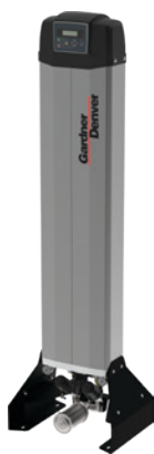
Serie GDX7M -40°C DS a GDX50M -40°C DS Caudales desde 0,67 m 3 /min