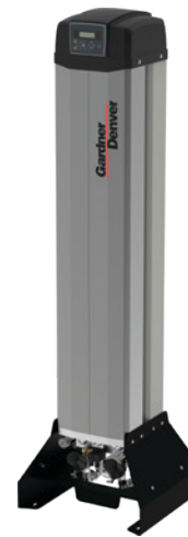
Serie GDX7M -70°C a GDX50M -70°C Caudales desde 0,67 m 3 /min